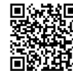
▲シラバス検索QRコード▲